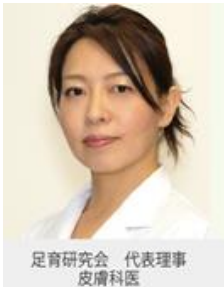
足育研究会 代表理事 皮膚科医

足の健康について専門家と一緒に考えて見ませんか？ 100歳まで自分の足で歩くために今、やるべきことがあるかも知れません。